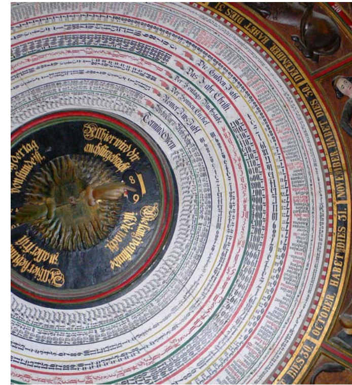
Rostock, Marienkirche, Die Astronomische Uhr