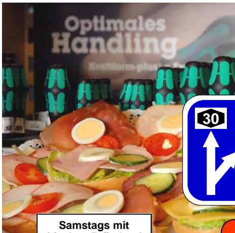
Samstags mit frischen Brötchen!