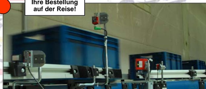
Ihre Bestellung auf der Reise!