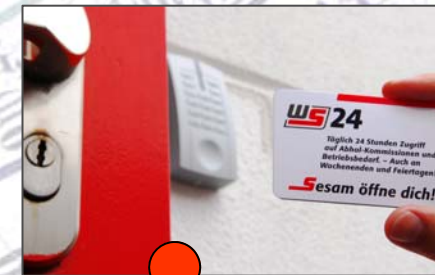
24 h an 365 Tagen im Jahr geöffnet!